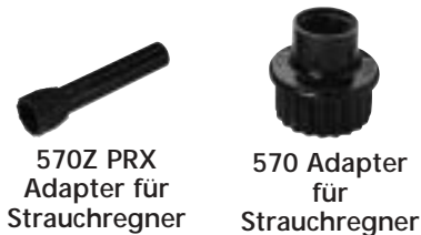
570Z PRX Adapter für Strauchregner

Effektive Beregnung kleiner Beete und Anpflanzungen. Geeignet für alle TORO Düsen und Siebe; zur Montage auf Standrohr mit Gewinde (1/2") Zoll (13 mm).