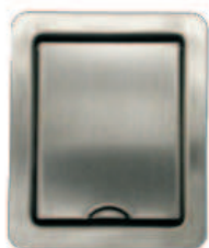
Art. Nr. rza203