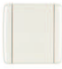
Art. Nr. rza204